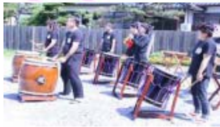
セメント住宅社 宅2周年記念 住吉まつりが 五月晴れの爽

やかな天候に恵まれて開催されました。毎年、ご参加いただいている須恵太鼓の皆さんの勇壮で力強い音色でオープニングです。会場いっばいに響き渡り、お祭り気分を盛り上げました。やっぱり、威勢のよい太鼓の演奏はお祭りには欠かせませんね。演奏の後はこれまた！パワフルな皆さんのお餅つきです。つきたてのお餅を目指して来られた方もあり、人気の餡餅はあっという間に完売しました。毎回楽しませてくださるお馴染みの皆さんに感謝です。(^^)