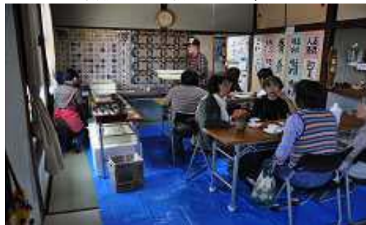
風景その2 学校給食のカレーライス

和室に特設のお食事コーナーが出現！ 際波台のケーキ屋さんのDecoreさんにも出張販売をお願いしました。