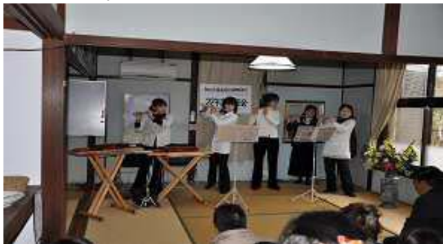
クリスタルフルーツ演奏風景

最後に全員で合唱した”ふるさと“は古き良き時代を懐かしく思い出させ、まさに龍遊館に相応しい歌でした。